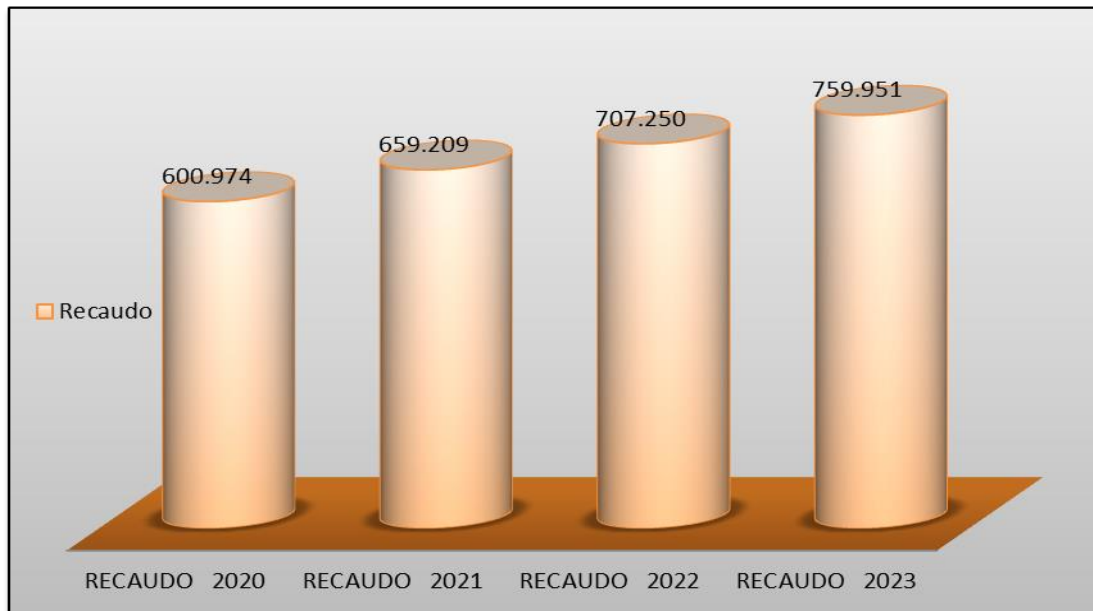
Gráfico 1 Ingresos Distrito Especial de Buenaventura Periodo 2020 - 2023

Fuente: Ejecuciones presupuestales de ingresos vigencias 2020 - 2023